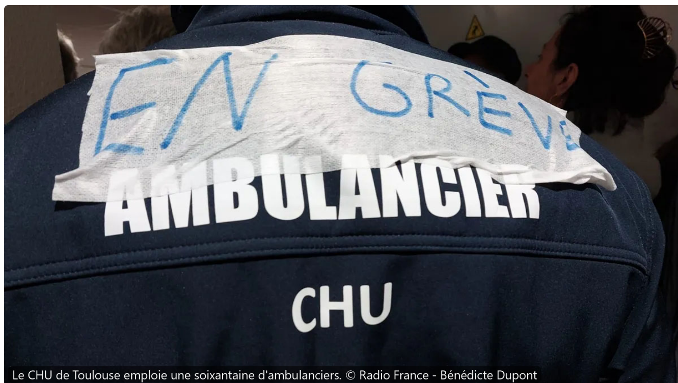
Le CHU de Toulouse emploie une soixantaine d'ambulanciers.